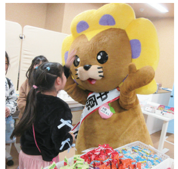
放課後、お友達と一緒に来た児童

✳️ 駄菓子屋さんを楽しそうだから、と地域の方が職員募集に応募してくれたり、入居者さんのご家族が、ボランティアに来てくれたりするようになった