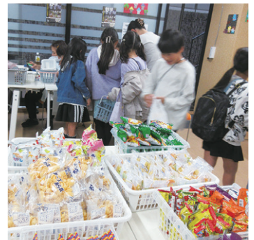
子どもたちに人気の駄菓子屋さん

始まったきっかけは地域の方の声 ▶▶ 「みんなの다가しや」は、地域の方を交えた運営推進会議で、母親クラブの方が発案されたそうです。最初は、老人ホームに子どもさんたちが来てくれるか心配だったそうですが、昨年6月の初回の来場者は、小学校のお子さんや保護者の方々など、なんと118名！ 以後、多世代交流の場として参加の輪が広がっています。