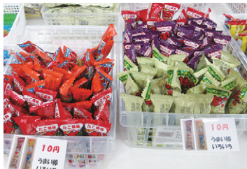
カラフルな駄菓子がたくさん！

子どもからお年寄りまで、誰でも楽しく集える多世代交流の広場 ヴィラージュ中原「みんなの다가しや」に参加しました！